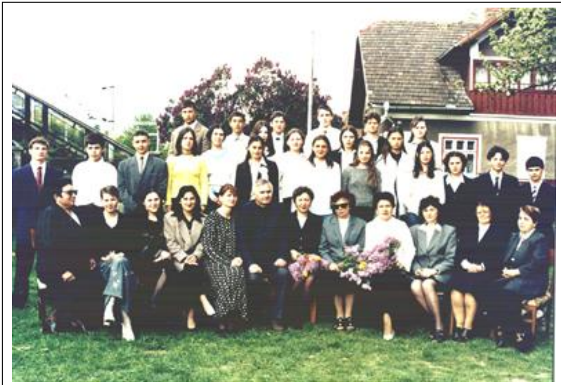
Absolvenții clasei a VIII-a A