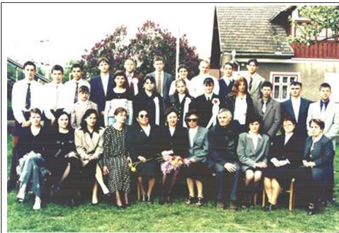
Absolvenții clasei a VIII-a B